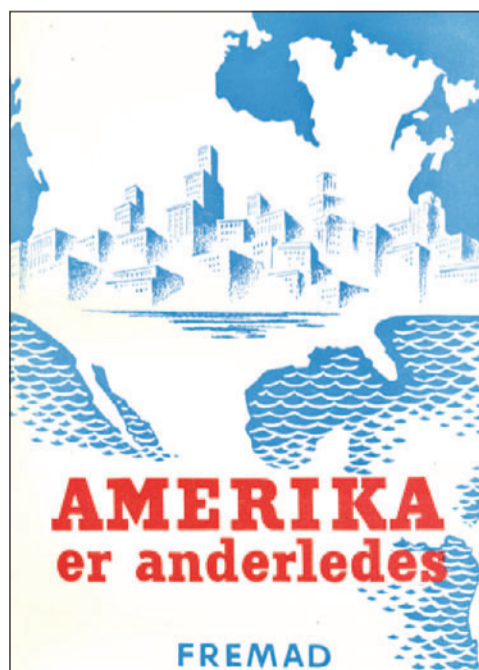
Kritisk propaganda fra 1950.

AFLs aktiviteter i Danmark og Europa havde to formål. Dels at introducere Marshall-hjælpen, som blev lanceret i 1948. Dels at bekæmpe kommunismen, som i Europa havde opnået legitimitet gennem Sovjetunionens krigsindsats og nationale kommunistiske bevægelses modstandskamp. En legitimitet,